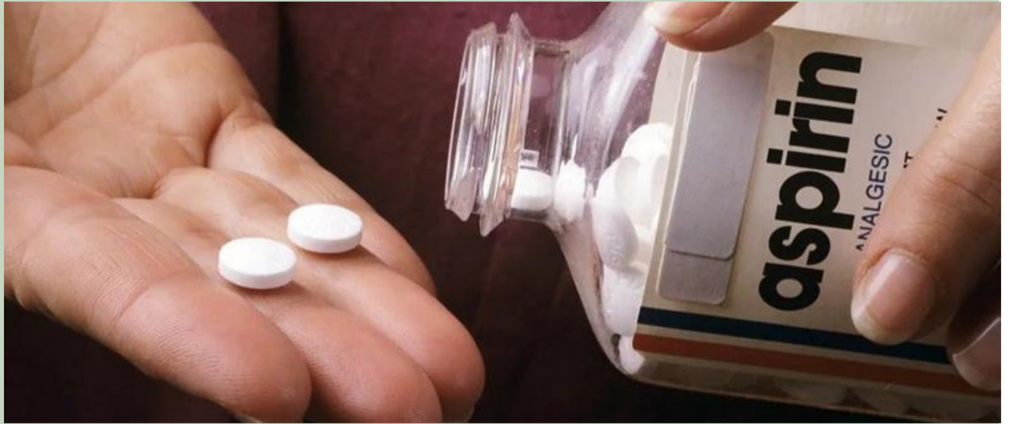
Vieux de 4.000 ans, l'aspirine est un anti-inflammatoire connu partout mais peut réduire le risque de cancer.