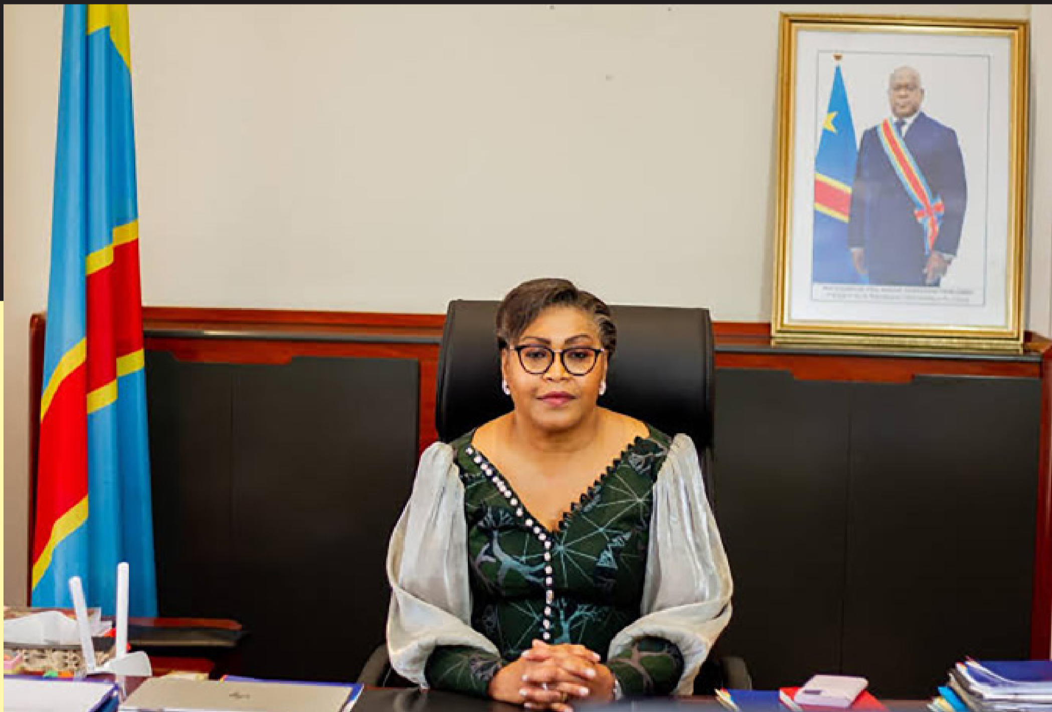
La Première ministre Judith Siminwa Tuluka s'est déjà mise au travail en engageant des consultations en vue de la formation de son gouvernement.