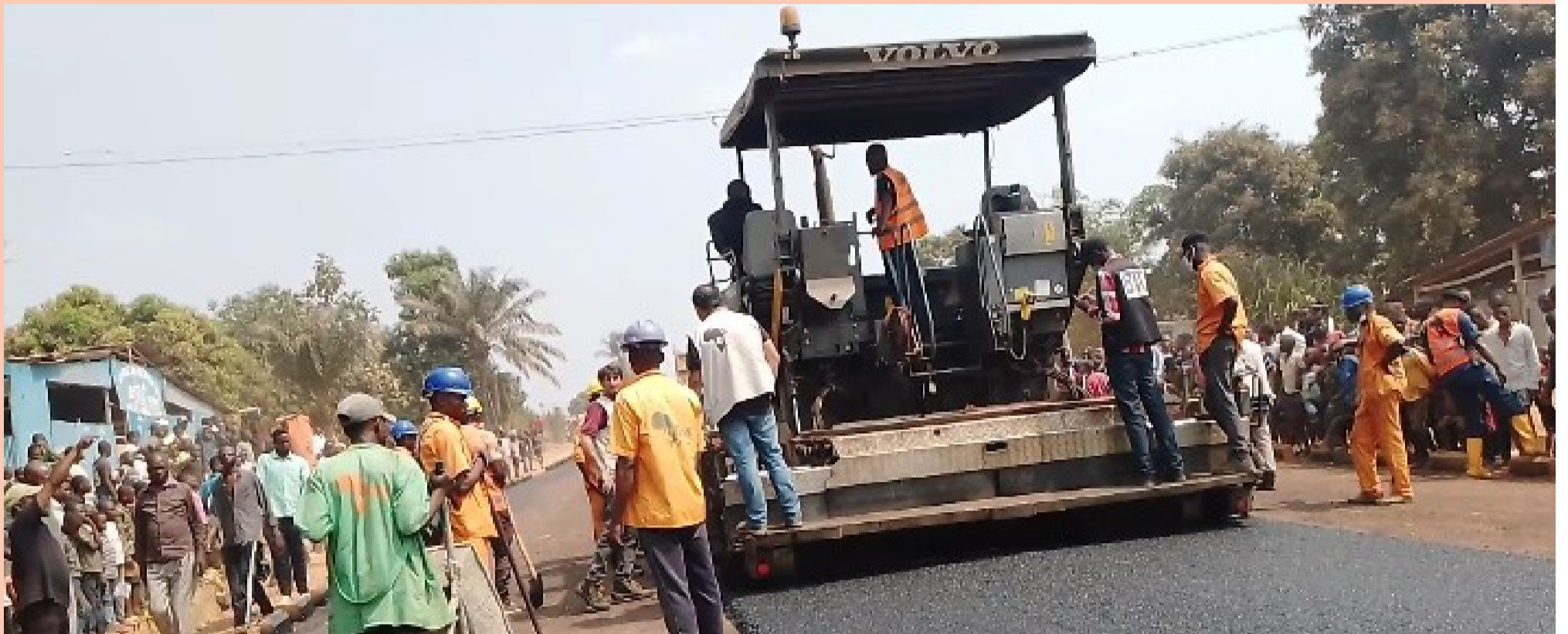
Les travaux de la ville de Mbuji-Mayi, capitale de la province du Kasai Oriental, demandent à être audités.

Toutefois, rapporté au linéaire, l'OVD offre donc à Safrimex SARLU le marché à près de 3,6 millions de $US/kms. Que dire? Tant pis pour personne. Depuis le controversé projet des 100 jours, la ville du Kasai Oriental s'est, en effet, bâtie la funeste réputation d'un pandémonium du roi de Pétaud : on pille, on détourne en arguant travailler au nom du Chef de l'État, l'enfant du terroir. En conséquence, des chantiers et autres projets quoique vachement surfacturés