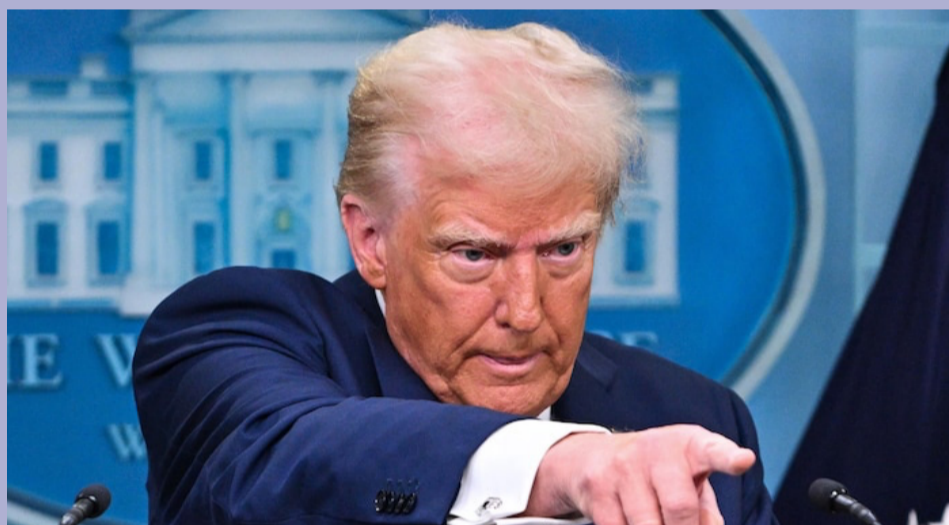
Donald Trump et Keir Starmer. À la réunion d'urgence du Conseil de Sécurité à New York, dimanche 26 janvier, leurs diplomates étaient en pointe.