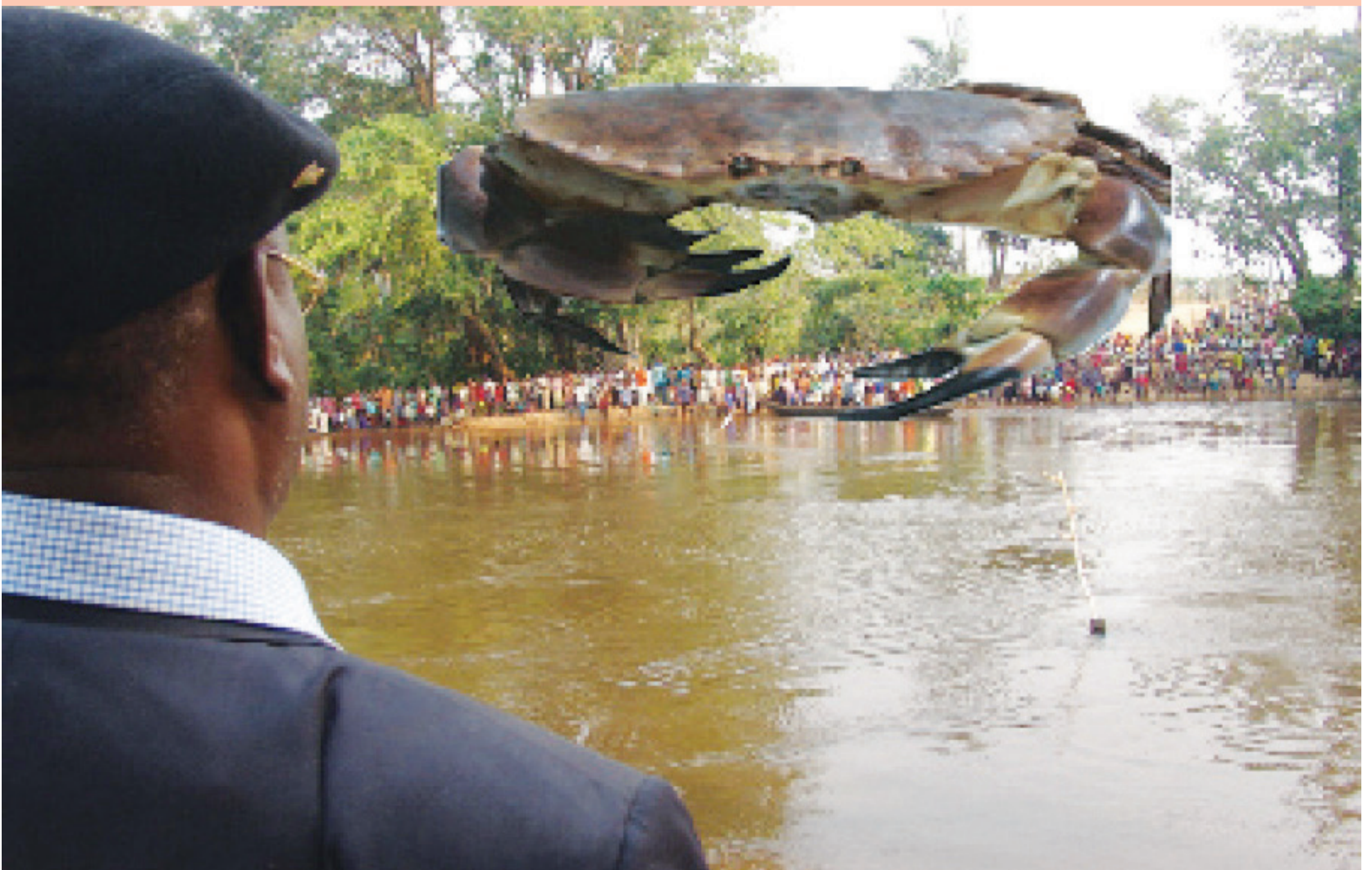
SUR LES BORDS DE NOTRE LUIE, SUR NOS TERRES BÉNIES DU BANDUNDU, DANS LE MASIMANIMBA, DES VILLAGES ENTIERS SE VIDENT ET ENTRENT EN TRANSE À L'APPARITION DE YA KHALA (LE GRAND CRABE). UNE HISTOIRE VIENT DE COMMENCER. DR.