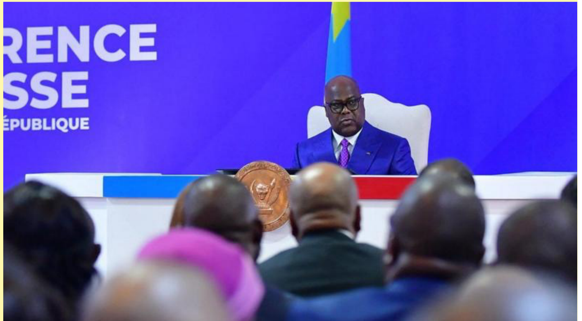
Une image de cette grande conférence de presse du 6 mai 2026 à la Cité de l'UA dont l'Histoire parlera.