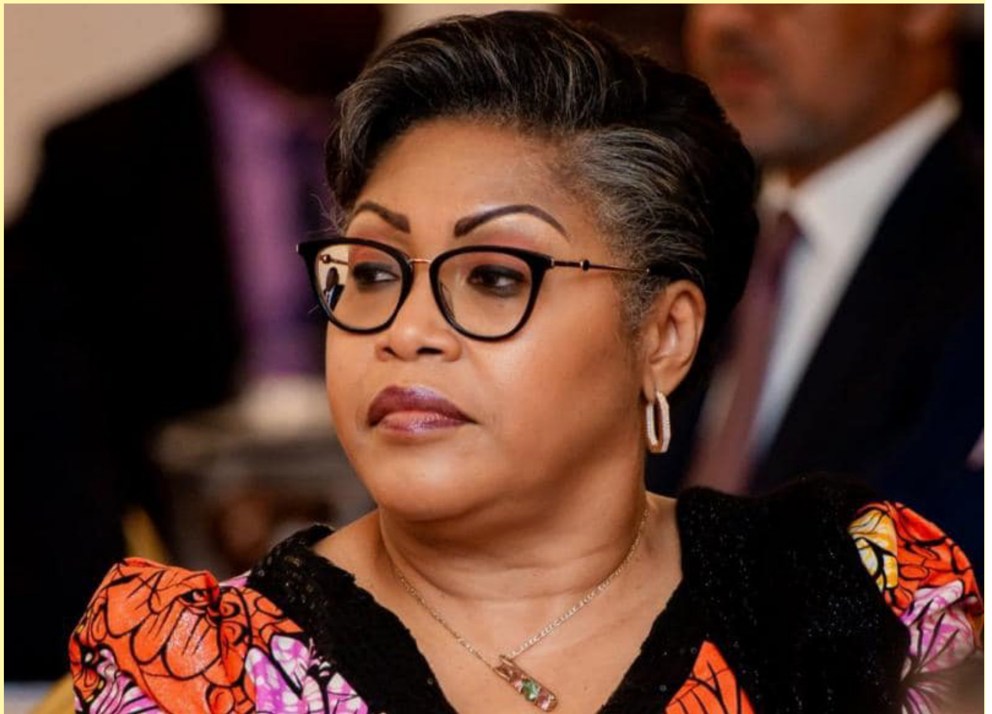
Mme Judith Suminwa Tuluka nommée le 1er avril 2024 Première ministre par le Président de la République.

LE CONTENANT C'EST LE CONTENU. Rappel des principes rudimentaires. Ceux enseignés dans les écoles en l'espèce à l'entrée. Le contenant c'est le contenu. Le contenu c'est le contenant. C'est l'interdépendance totale entre la forme (le contenant) et le fond (le contenu). Le contenant est le récipient, l'espace (la boîte, la bouteille, le cadre). Le contenu est la matière ou l'information à l'intérieur (le liquide porté, l'idée portée, le message porté). Aller à tombeau ouvert en chambre et chercher à y trouver qui l'on cherche suppose la maîtrise préalable des extérieurs. Nul homme censé ne s'y risquerait autrement. Rappelons que la forme extérieure amène au fond. Le récipient, l'espace, le cadre, l'emballage, le packaging, le format, l'apparence, la