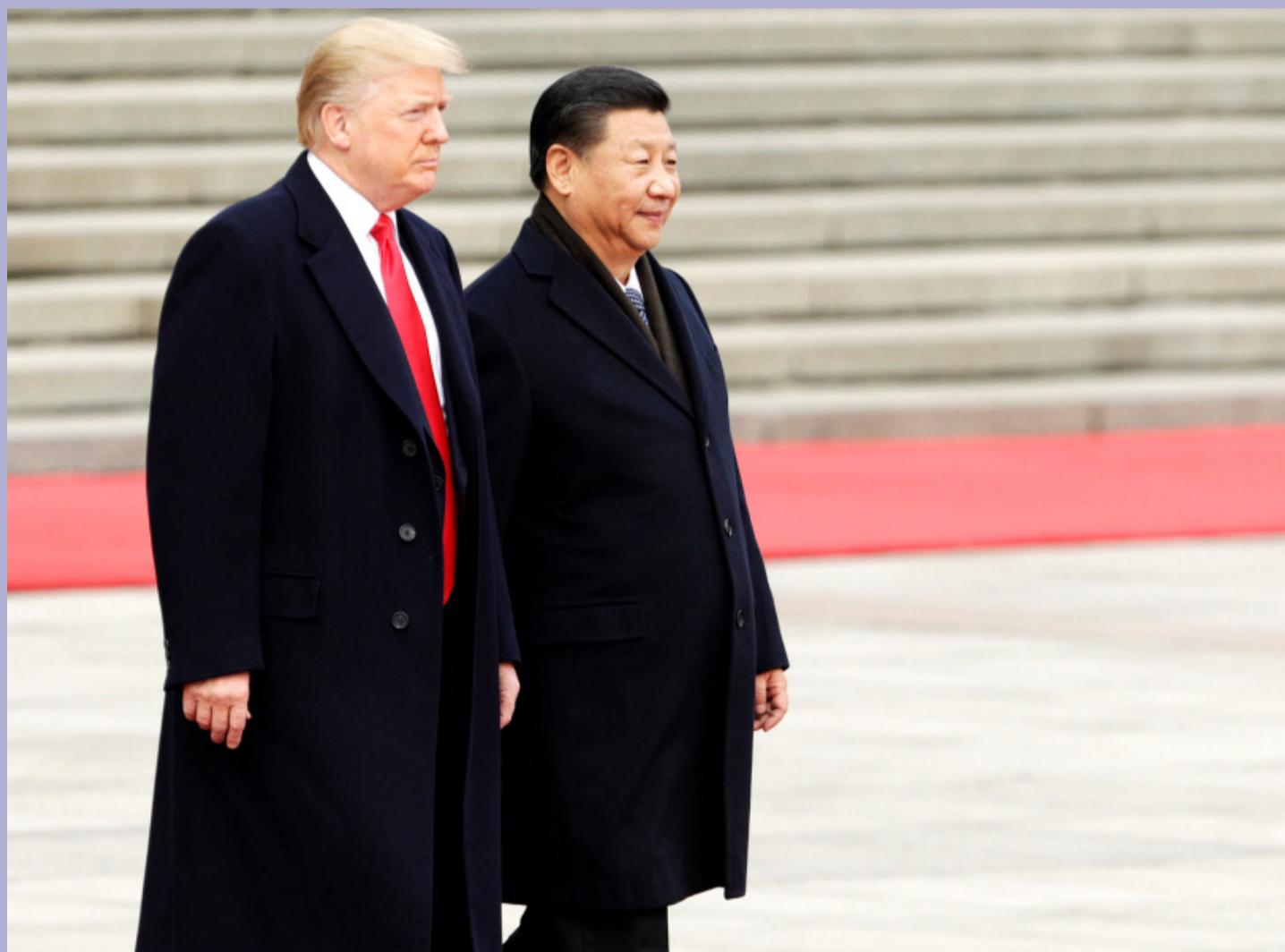
Donald Trump accueilli en grande pompe en 2017 par son homologue Xi Jinping. DR.

« Je viens de lire la réponse des soi-disant «représentants» de l'Iran. Je ne l'aime pas - C'EST TOTALEMENT INACCEPTABLE ! », a écrit en lettres capitales le président américain dans un bref message sur son réseau Truth Social. La télévision publique iranienne s'est bornée à rapporter que la réponse de Téhéran, transmise via le médiateur pakistanais, était « axée sur la fin de la guerre (...) sur tous les fronts, en particulier au Liban, et sur la garantie de la sécurité de la navigation maritime ». D'après le Wall Street Journal (WSJ), qui cite des sources proches du dossier, la proposition de Téhéran prévoit une réouverture graduelle du détroit d'Or-