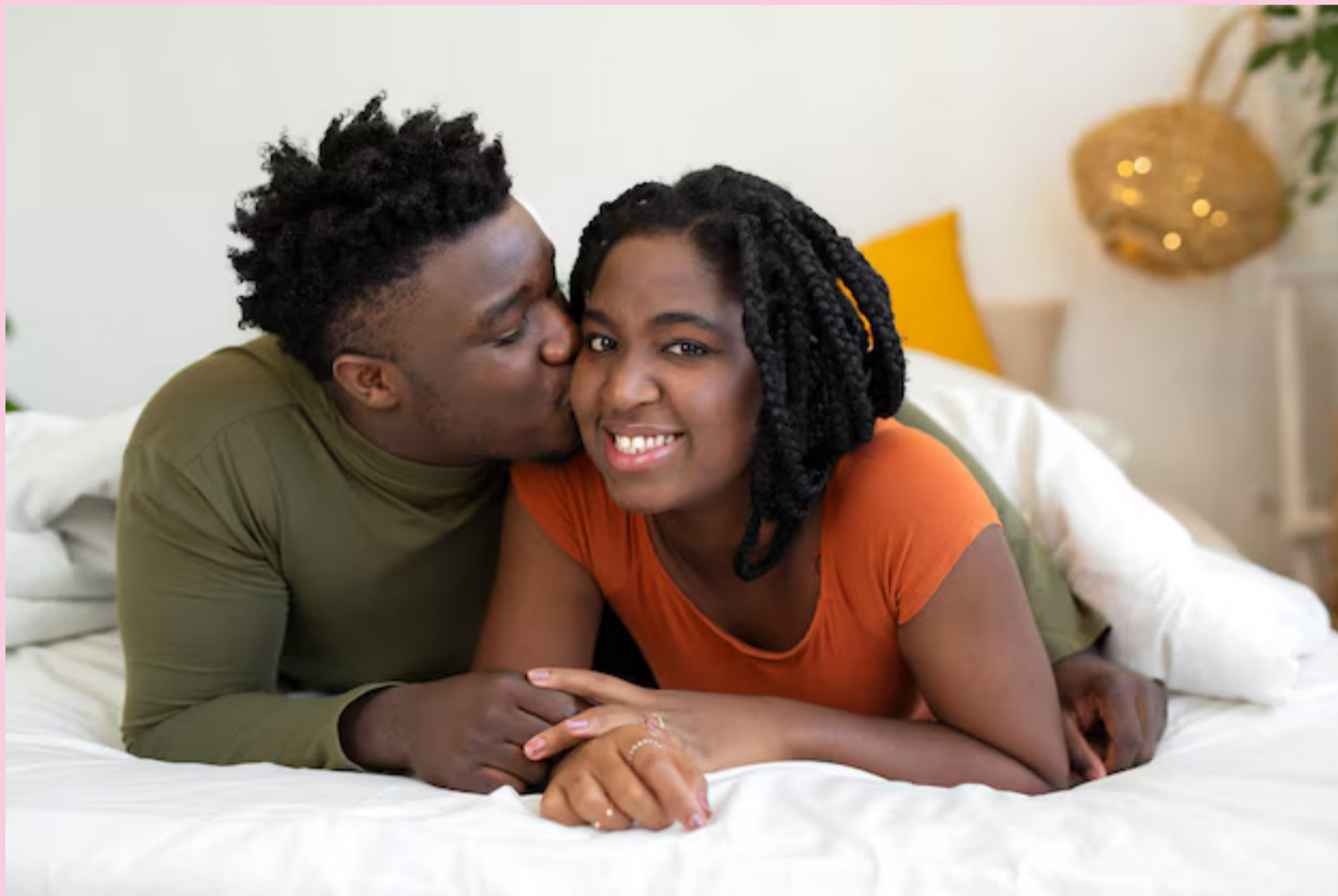
Cette histoire d'une Reine frustrée dont le mari était tout le temps parti et qui fit naître le lac Kivu.

Alors cela vous tente? Il y en a à qui cela ne dit rien, mais il en y a qui ne rêvent que de ça et qui disent que sans cela, il n'y a plus de plaisir, encore moins de grand plaisir... Plongeons-nous dans ce mystère qui y est dévoilé, selon lequel le plaisir de la femme pendant l'acte sexuel s'exprimerait par le jaillissement d'une eau intime. Un jaillissement rendu possible par la pratique du kunyaza. C'est le nom rwandais donné à une pratique sexuelle trouvée dans la région des Grands lacs africains qui est destinée à faciliter l'orgasme féminin pendant les rapports