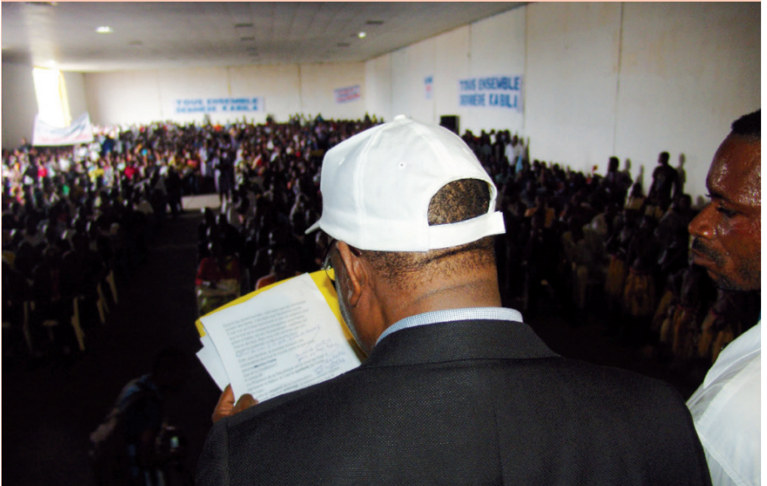
CECI S'APPELLE CERTAINEMENT UNE SALLE NOIRE DE MONDE QU'AUJOURD'HUI AUCUN AUPARAVANT N'AVAIT JAMAIS REMPLIE MAIS OÙ, EN PLEINE PÉRIODE D'INCERTITUDE, LE PARTI POUR L'ACTION-LE PARTI DU CRABE REFUSE DU MONDE. DR.