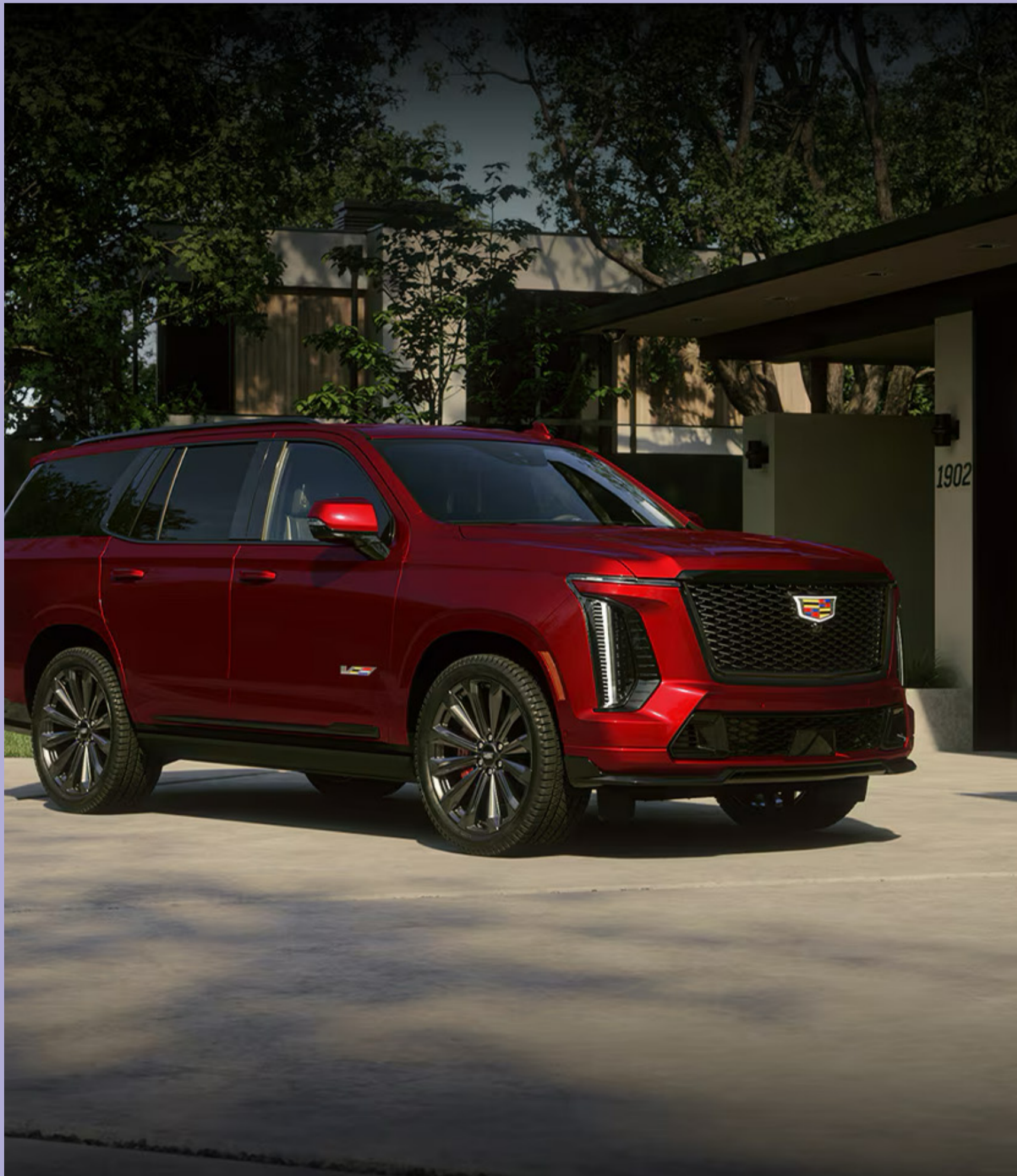
Nul doute, l'Escalade constitue le porte-étendard de Cadillac depuis un quart de siècle. DR.

Par rapport au Lincoln Navigator et le Jeep Wagoneer, l'Escalade propose un habitacle fort spacieux. « Toutes proportions gardées, c'est GM qui offre le meilleur espace intérieur. (Il s'agit d'un trône qu'on a obtenu depuis l'arrivée d'une suspension indépendante, parce que dans le passé, on avait un essieu rigide à l'arrière qui faisait rehausser le plancher du coffre », explique un chroniqueur. De plus, l'Escalade demeure le produit le plus populaire de la catégorie. En chiffres, 2.848 unités ont trouvé preneur auprès des consommateurs canadiens en 2024. Aux États-Unis, ce nombre grimpe à 41.672 unités écoulées. « Beaucoup d'améliorations sont apportées au Cadillac Escalade pour 2025. La première que l'on constate est l'assistance à l'ouverture et à la fermeture des portes. (...) Il y a un moteur électrique qui permet de faciliter l'ouverture et la fermeture », mentionne le chroniqueur. Bien sûr, l'habitacle luxueux contient de nombreuses commodités et arbore une nouvelle planche de bord. Celle-ci intègre dorénavant un im-