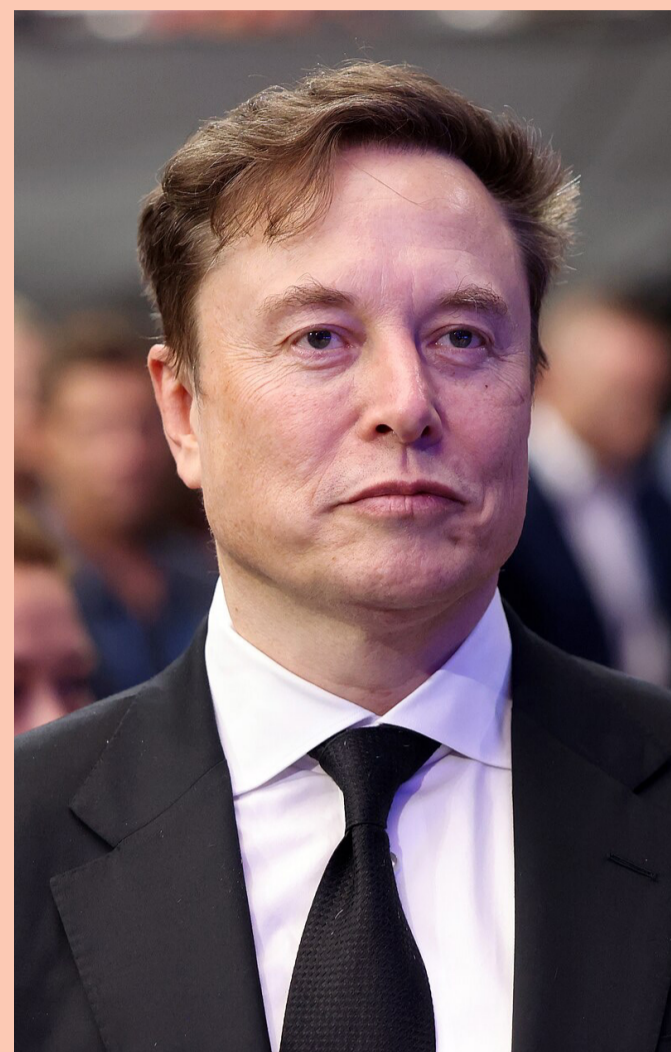
Le milliardaire américain Elon Musk.

Cet accord, dont ni les détails financiers ni la durée n'ont été dévoilés, permettra sans délai au rival d'OpenAI de « doubler les limites d'utilisation » de ses modèles Claude pour ses abonnés payants, et « d'augmenter considérablement » ses quotas pour les développeurs, a-t-elle ajouté, suscitant un frisson dans la salle remplie d'ingénieurs de la Silicon Valley. Victime de son succès, Anthropic ne parvenait plus depuis des mois à satisfaire la demande, nombre d'abonnés professionnels se plaignant d'épuiser leur quota en moins de vingt minutes avec les modèles de pointe. En mars, l'entreprise de San Francisco, qui prépare une entrée en bourse retentissante, avait dû réduire les quotas pendant les heures de pointe, faute d'avoir assez de processeurs pour satisfaire toutes les requêtes. À l'inverse, l'entreprise de Musk xAI se trouve en surcapacité, n'utilisant qu'une faible part de la puissance de calcul de Colossus. Le plus grand de ses centres de données,