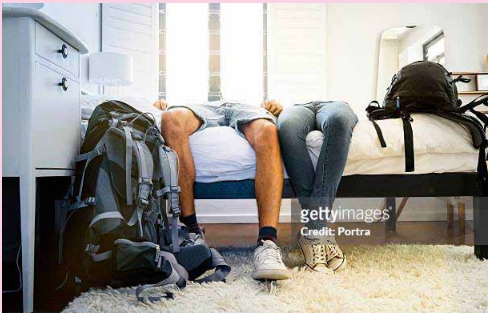
En France, plus d'un quart des jeunes (18-24 ans) n'ont un seul rapport au cours de l'année.

Les Français font de moins en moins l'amour. C'est ce qu'affirme cette étude rendue publique lundi 12 février 2024. Ainsi, le nombre de personnes ayant eu un rapport au cours des 12 derniers mois n'a jamais été aussi faible en cinquante ans : 76% en moyenne, soit une baisse de 15 points par rapport à la dernière grande enquête sur les comportements des Français conduite en 2006. Une tendance à la baisse qui affecte autant les hommes (78%, contre 93% en 2006) que les femmes (74%, contre 89% en 2006). Voilà peut-être un début de réponse quant aux causes de la chute historique des naissances enregis-