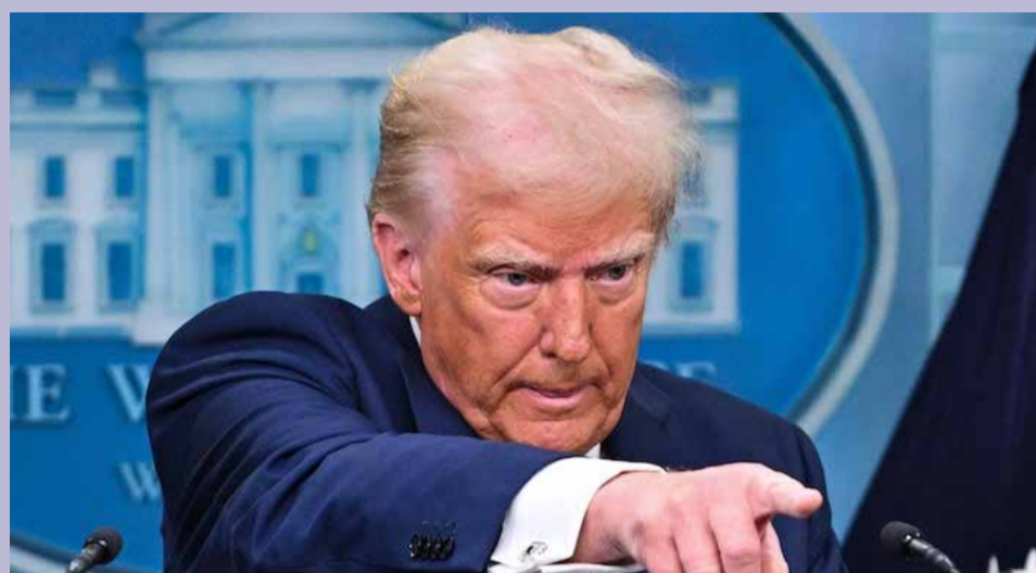
Donald Trump et Keir Starmer. À la réunion d'urgence du Conseil de Sécurité à New York, dimanche 26 janvier, leurs diplomates étaient en pointe.