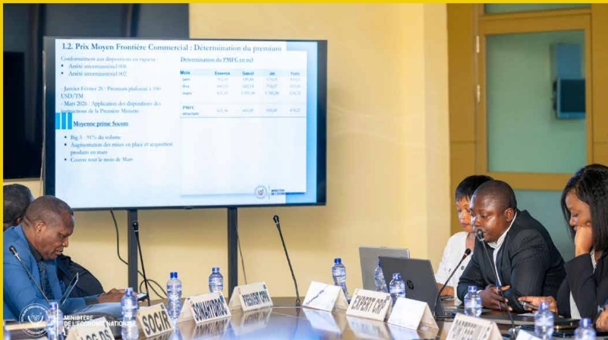
Vue de la réunion des membres du Comité de Suivi des Prix des Produits Pétroliers (CSPPP) tenue les 28 et 29 mai 2026.