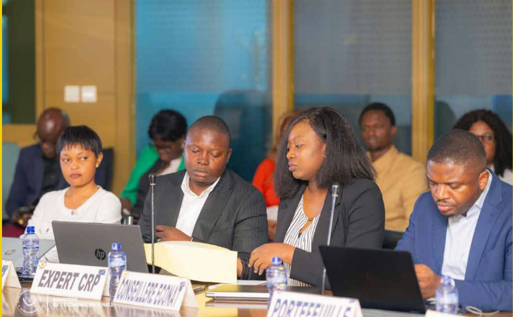
Vue de la réunion des membres du Comité de Suivi des Prix des Produits Pétroliers (CSPPP) tenue les 28 et 29 mai 2026.