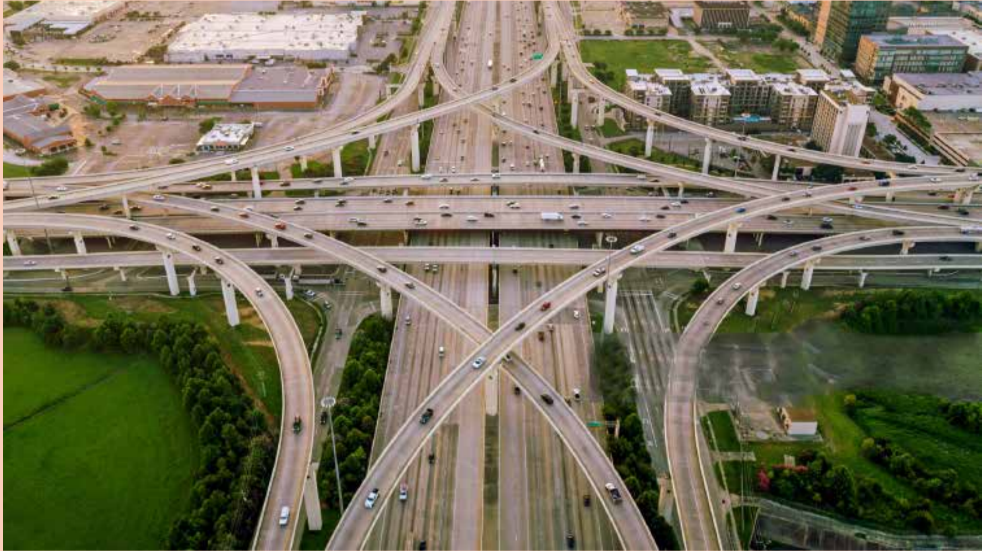
États-Unis, Texas, Houston-Katy. La circulation automobile par ponts aériens surélevés qui désengorge.