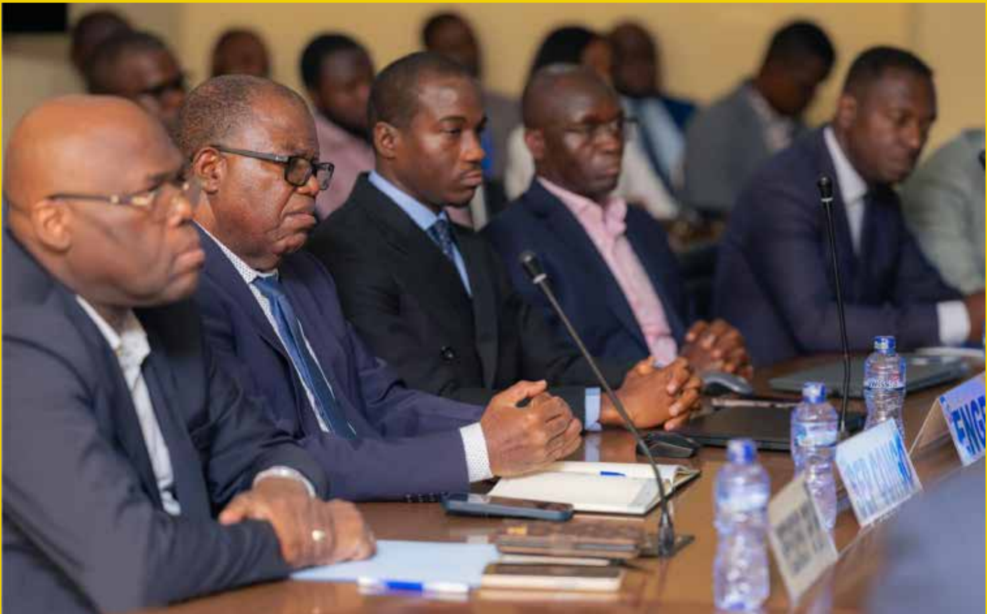
Vue de la réunion des membres du Comité de Suivi des Prix des Produits Pétroliers (CSPPP) tenue les 28 et 29 mai 2026.

Fait à Kinshasa, le 29 mai 2026 Cellule de communication.