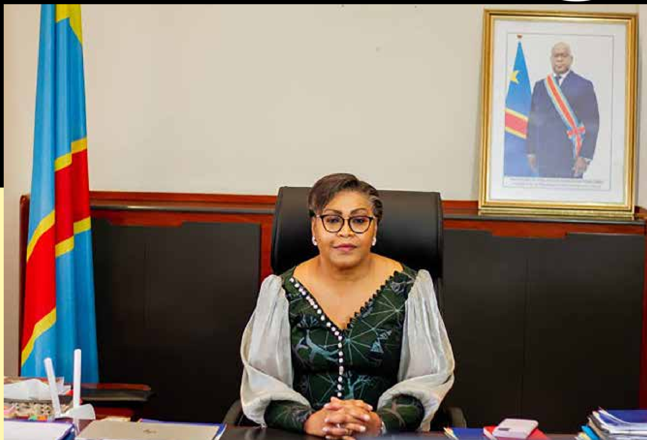
La Première ministre Judith Siminwa Tuluka s'est déjà mise au travail en engageant des consultations en vue de la formation de son gouvernement.