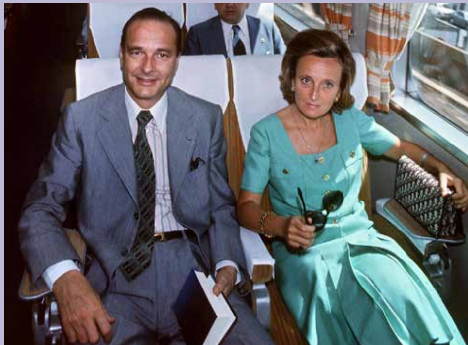
Bernadette rejoint son mari près de 7 ans plus tard.