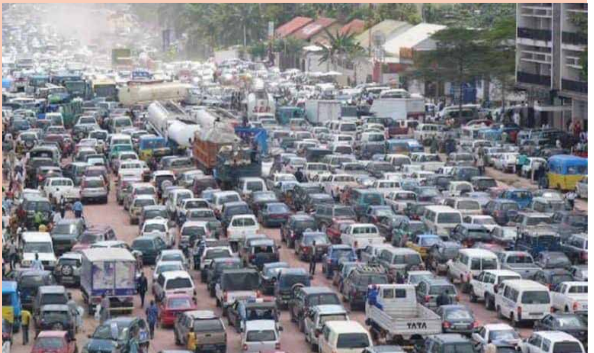
À Kin, l'incroyable nombre de véhicules et de motos qui prennent la route et l'absence de voies créent le chaos.