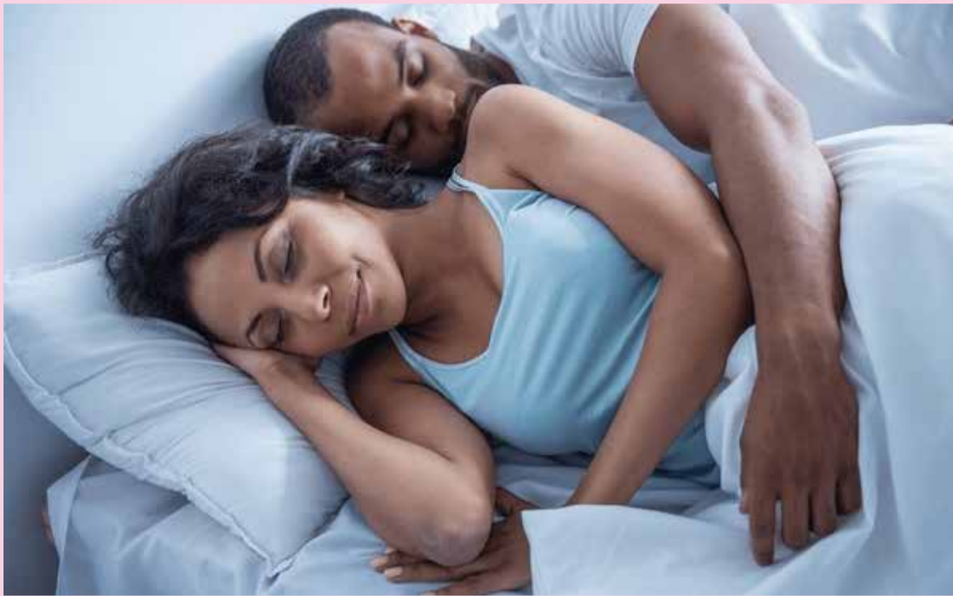
Fellation, romantisme ou amour ? Les avis vont dans tous les sens.