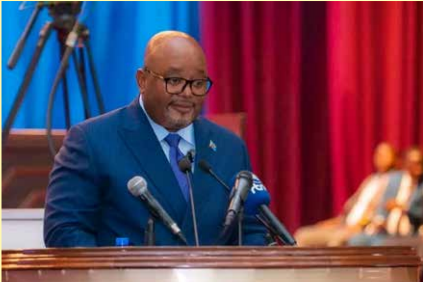
À g., les présidents Boji Sangara Bamanyirue (Chambre basse), à dr., Sama Lukonde Kyenge (Chambre haute).

À l'Assemblée nationale comme au Sénat, vingt-six matières sont inscrites à cette session extraordinaire dominée par des textes portant à la gouvernance économique, aux infrastructures, à l'énergie, à l'agriculture, à la sécurité et aux investissements stratégiques. Le parlement examinera en priorité le projet de loi de finances rectificative destiné à ajus-