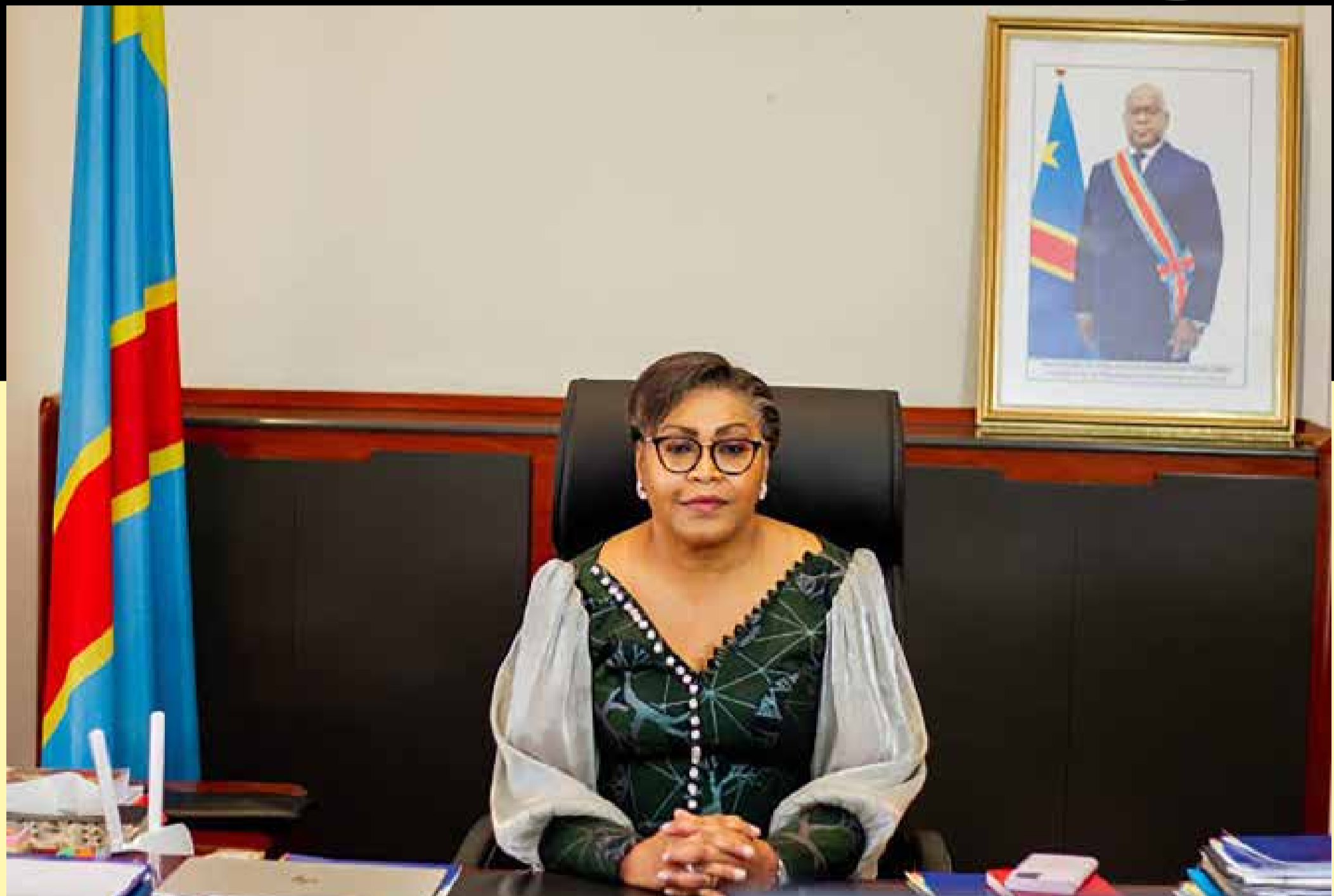
La Première ministre Judith Siminwa Tuluka s'est déjà mise au travail en engageant des consultations en vue de la formation de son gouvernement.