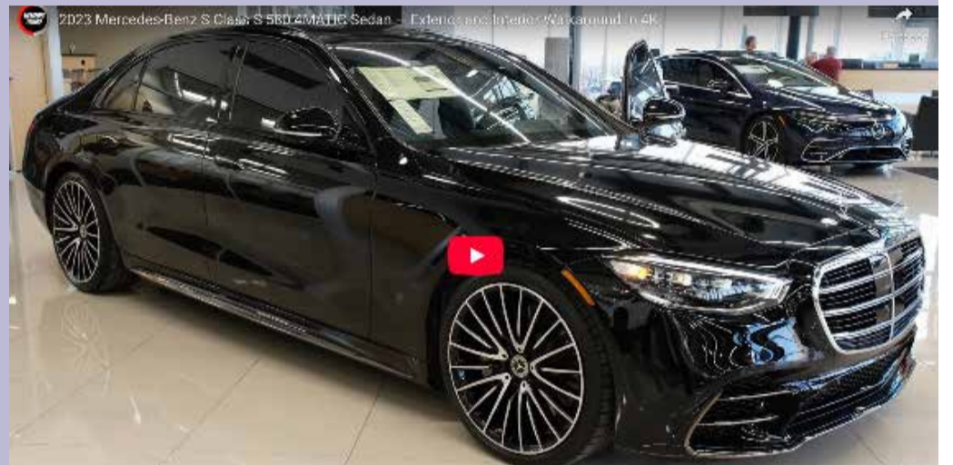
Ferrari, Bentley, Lamborghini, Rolls-Royce, Porsche, Mercedes S, Maserati. Cabriolet, SUV de luxe ou bien coupé. DR.