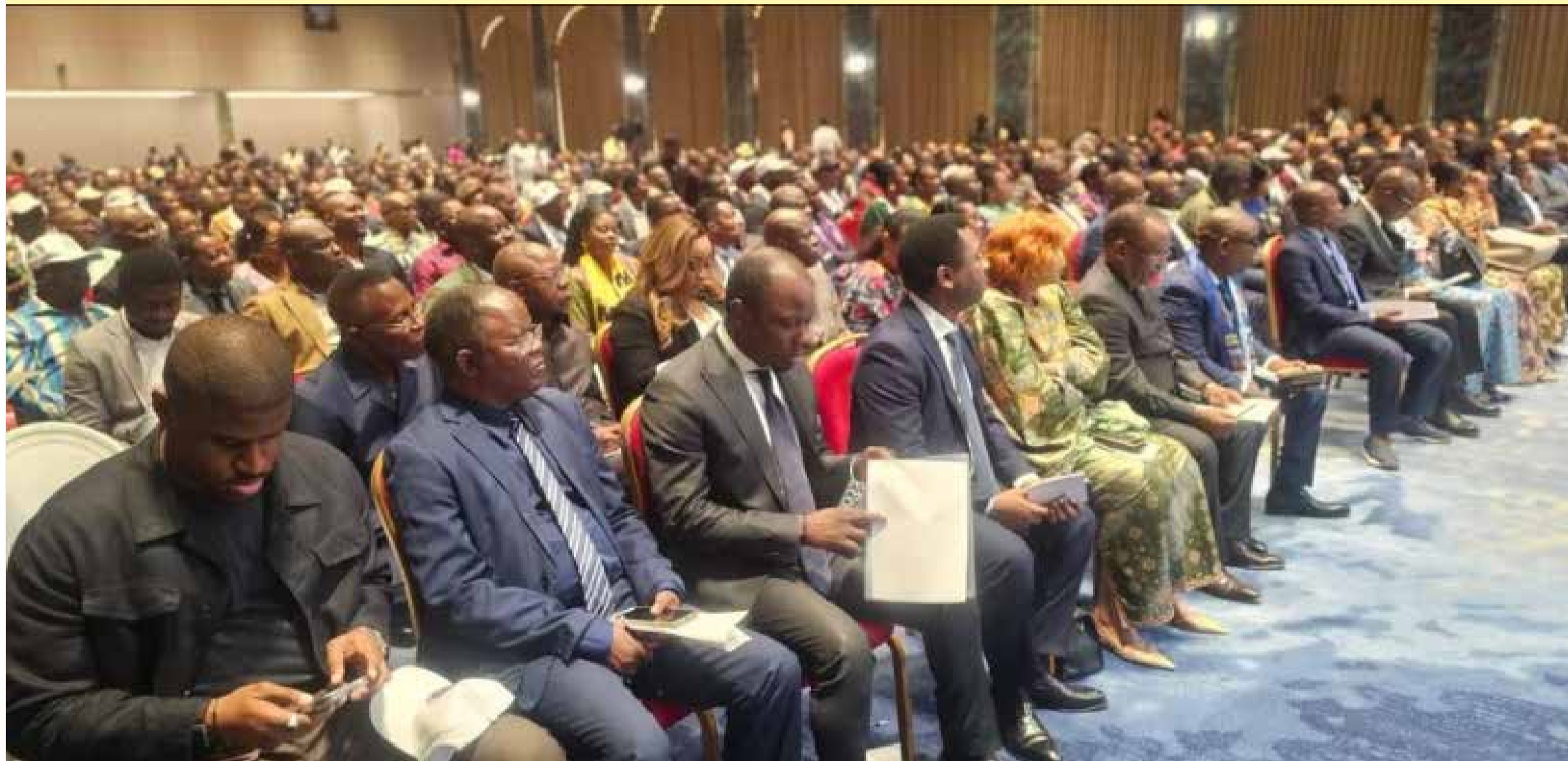
Une salle Fleuve Congo Hôtel pleine à craquer de députés, sénateurs, présidents de partis politiques et de regroupements membres USN. DR.

L' Union Sacrée de la Nation a suivi avec indignation et condamne avec la dernière énergie la déclaration faite par quelques Evêques catholiques, en date du 20 juin 2026, au nom de la CÉNCO, concernant la question du changement de la Constitution.