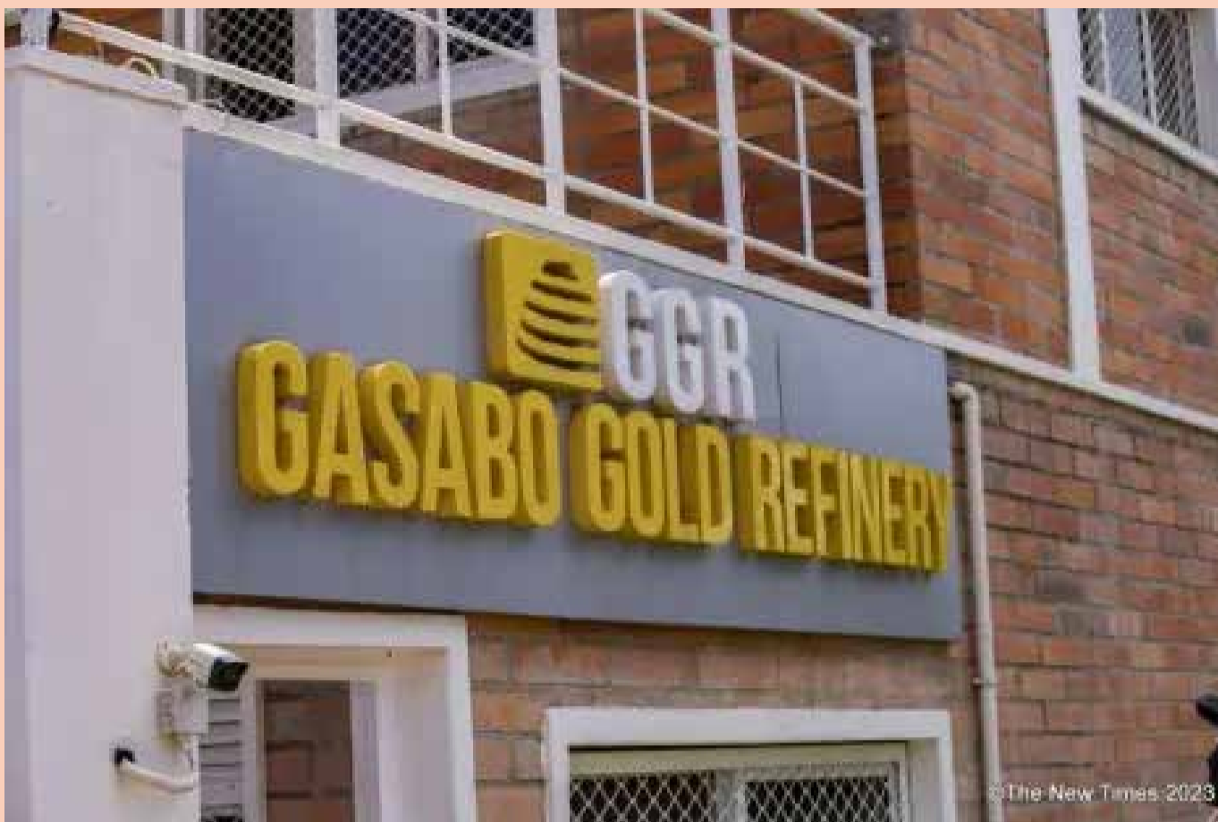
Soucieuse d'exécuter son deal minerais rares contre sécurité à l'est du Congo, l'Administration Trump n'arrête de frapper le régime qui retarde ce projet.

C'est un nouveau coup dur au plan économique et donc politique et diplomatique pour le régime rwandais et son dirigeant Paul Kagame. Quand on sait qu'il y a quelques temps, le président rwandais s'était plaint publiquement et directement à Kigali de « ces sanctions » qui s'abattent sur son pays, on comprend mieux le nouvel état