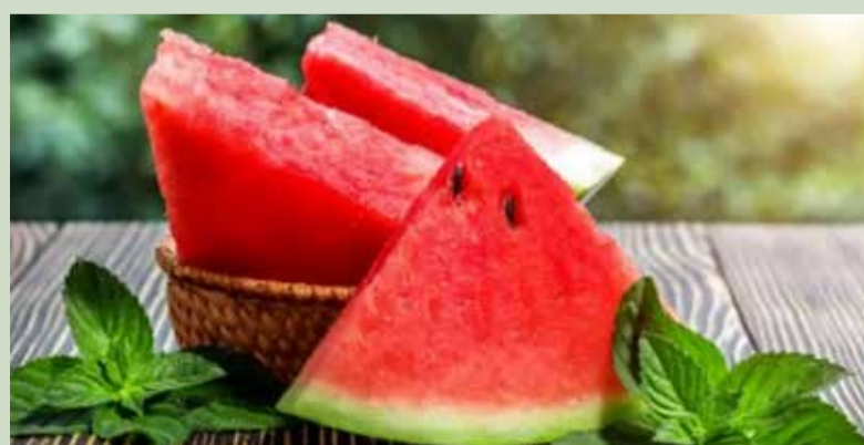
Le pastèque aide à stimuler la libido.

Le Viagra agit sur les vaisseaux sanguins de la même manière que la citrulline, une substance chimique naturelle présente dans la pastèque. La citrulline contenue dans la pastèque détend les vaisseaux sanguins, améliorant ainsi la circulation. Une bonne circulation sanguine est essentielle