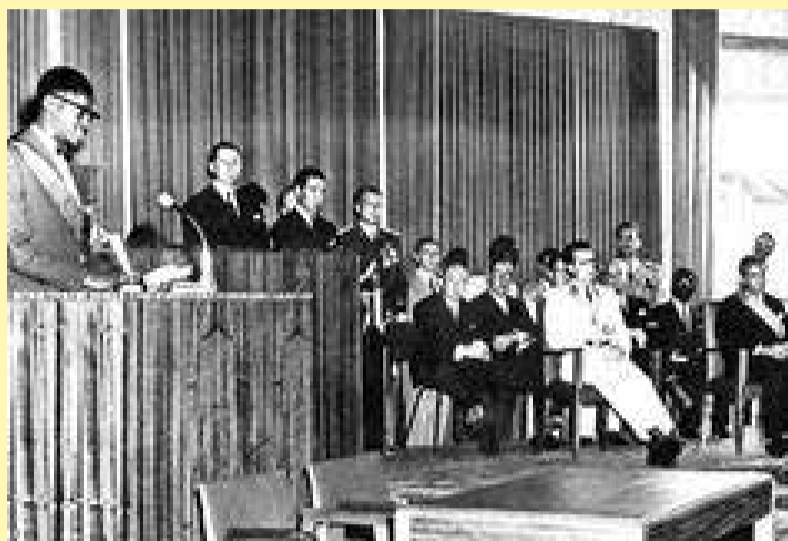
La gifle de Lumumba contre le roi des Belges.

Les Congolais en ont assez de l'asservissement de l'autorité coloniale. Ils attendent une occasion pour l'exprimer ouvertement. Il est sûrement écrit quelque part que cet événement arriverait au moment le plus inattendu. Contre toute attente c'est le 4 janvier 1959 qu'il survient. C'est à cette date que l'empire colonial belge est ébranlé sur ses bases. Et l'histoire coloniale belge est bas-