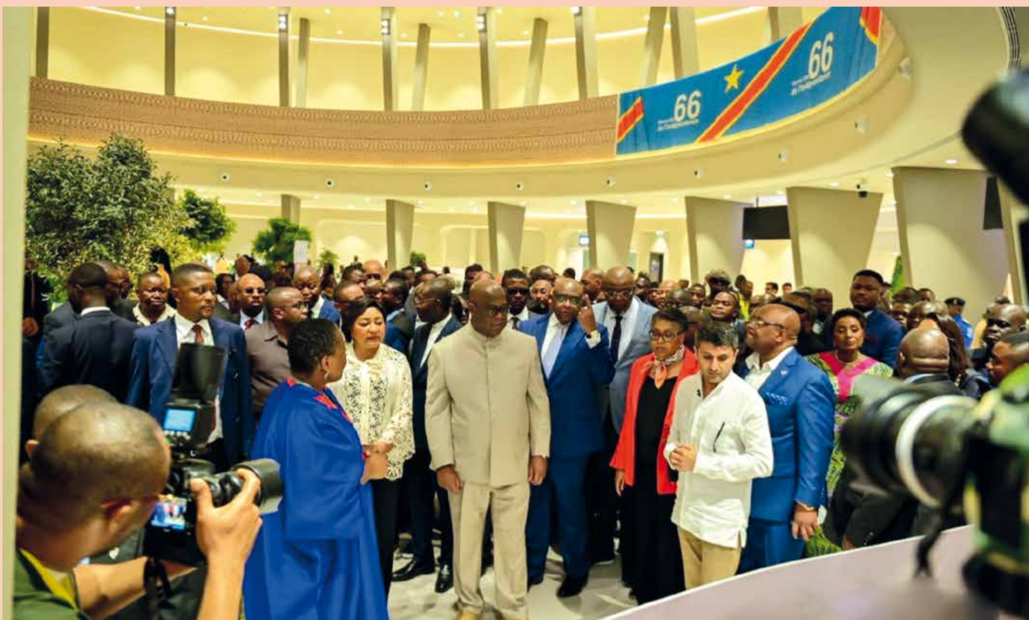
Ci-haut visite-réception de la Rotonde. Ci-bas, attente de l'atterrissage du Dreamliner Boeing 787-800 d'Air Congo.

Le 14 février 1959, le Belge Henri Cornelis, gouverneur général du Congo-Belge et du Rwanda-Urundi, ouvre les portes de l'Aéroport de N'djili, principale porte d'entrée et de sortie de la capitale Léopoldville aujourd'hui Kinshasa. La piste de cet aéroport, longue de 4.694 m, reste la piste d'envol la plus longue du monde jusque dans les années 1960 lorsque les Belges accordent l'Indépendance à leur ancienne colonie. D'autres sources font figurer l'aéroport de Léopoldville parmi les quatorze aéroports au monde disposant d'une aussi longue piste civile. Tout part du Plan général pour le développement des plateformes aéroportuaires de