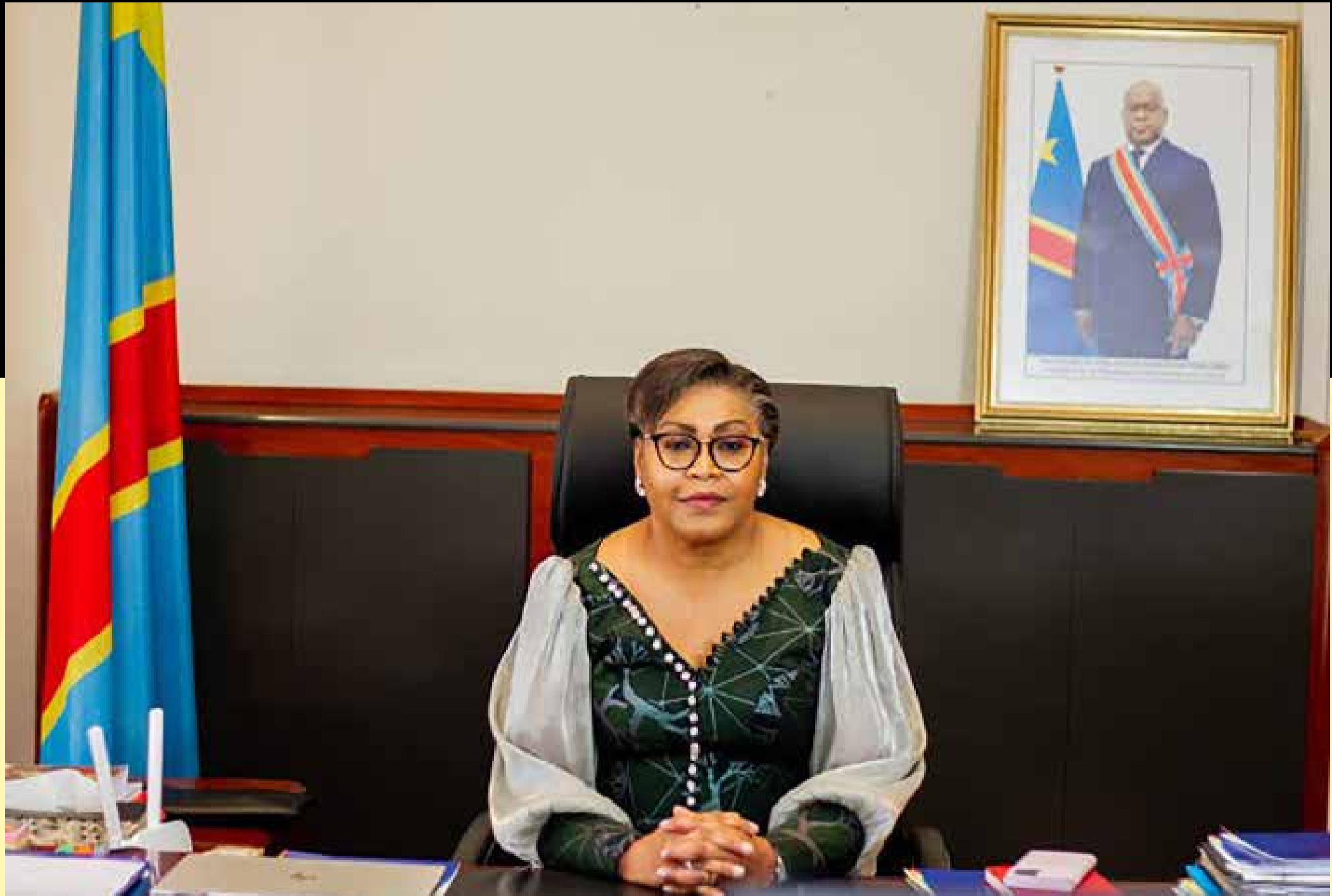
La Première ministre Judith Siminwa Tuluka s'est déjà mise au travail en engageant des consultations en vue de la formation de son gouvernement.