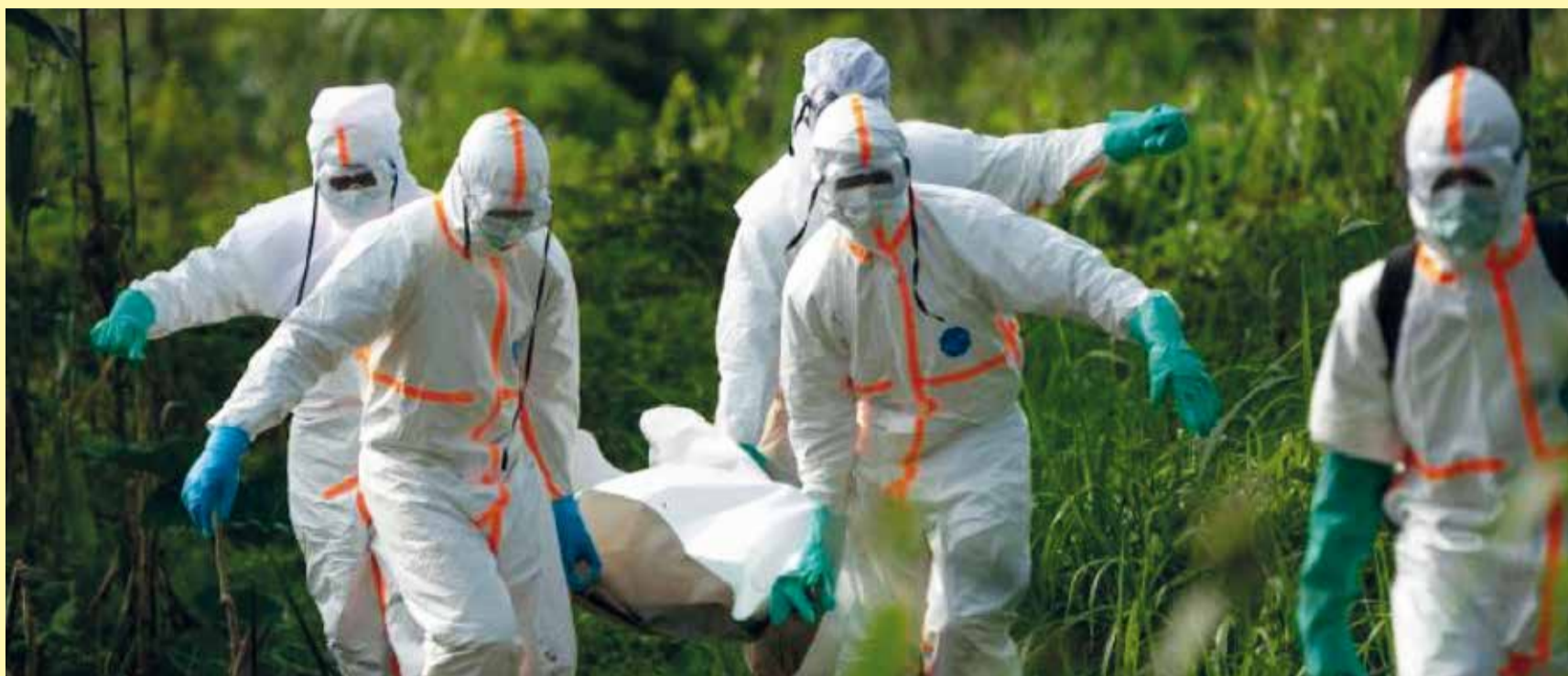
Ebola prend une ampleur particulièrement inquiétante et paraît désormais s'imposer comme l'une des crises sanitaires les plus fulgurantes de l'histoire récente du continent par sa vitesse de propagation initiale.

L'Ituri, Grande Orientale, à la frontière avec l'Ouganda et le Soudan du Sud, demeure l'épicentre, le principal foyer de l'épidémie, avec 24 zones de santé touchées. Le virus s'est propagé aux provinces voisines du Nord-Kivu placé sous surveillance prioritaire avec 11 zones et du Sud-Kivu, où la seule zone de Miti-Murhesa compte trois cas et un décès. Les autorités sani-