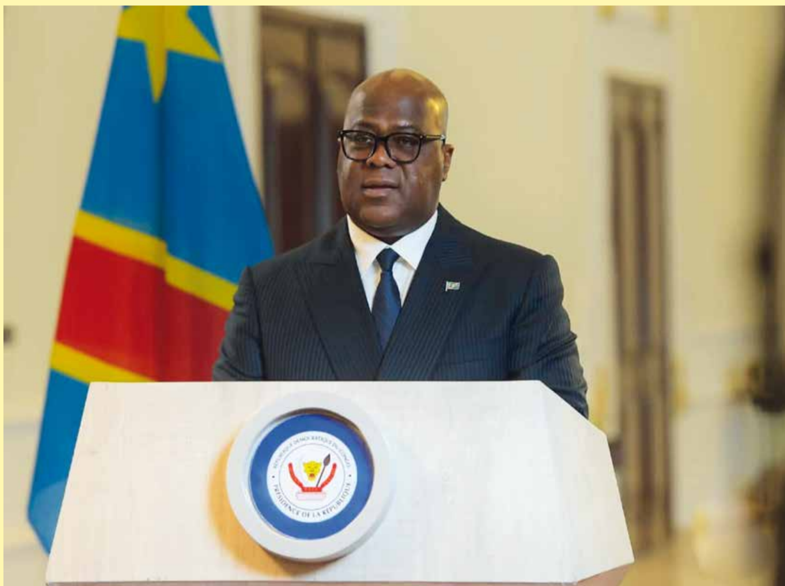
Le Président de la République, Félix-Antoine Tshisekedi Tshilombo lors de son discours.

bré un 30-Juin son indépendance arrachée des mains des Belges dans des défils gigantesques de jadis. Mais le pays a eu droit à l'habituel discours à la Nation du Chef de l'État. Le Président de la République Félix-Antoine Tshisekedi Tshilombo s'est adressé dès l'entame à ceux qui «tiennent les lignes, défendent nos frontières, protègent nos populations», en leur disant : « la Nation reconnaissante vous dit merci ». Puis : «Votre courage est le rempart de notre souveraineté, et votre engagement restera inscrit dans la mémoire de la République». Il a expliqué qu'«aucune paix durable dans la région des Grands Lacs ne peut se bâtir contre la souveraineté de la République Démocratique du Congo, ni au détriment de la dignité de son peuple». Sur «les Accords de Washington, les discussions de Doha et les engagements de Montreux», il a déclaré que ceux-ci «n'ont de sens que s'ils produisent des résultats concrets, vérifiables et irréversibles». Il a appelé au «silence des armes, à la fin de tout soutien aux groupes armés, au retrait effectif des forces étrangères non invitées, au désarmement des combattants, au retour digne et sécurisé des déplacés et des réfugiés, à la protection des civils, à la restauration de l'autorité de l'État, à la justice pour les victimes et aux garanties crédibles de non-répétition». Puis : «La paix ne peut être ni une mise entre parenthèses de la vérité, ni une récompense accordée à ceux qui prennent les armes contre la République,