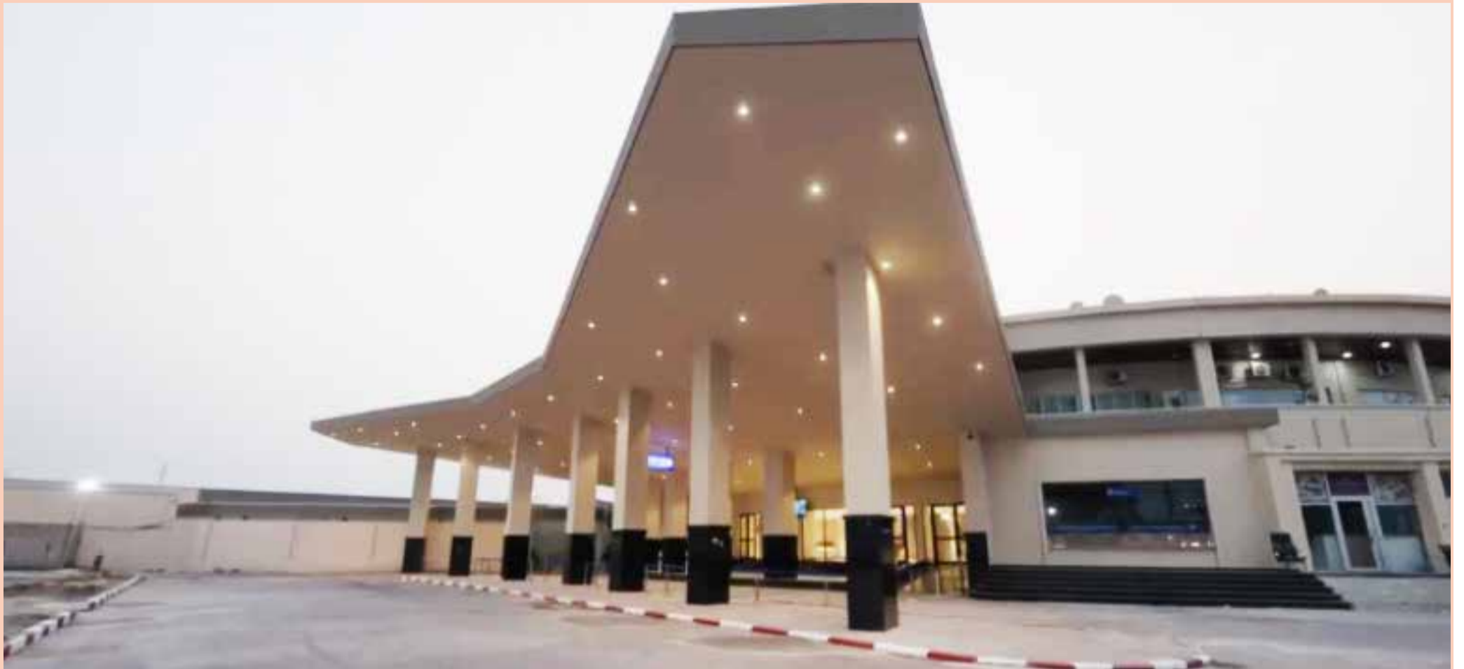
Soucieuse d'exécuter son deal minerais rares contre sécurité à l'est du Congo, l'Administration qui retarde ce projet. DR.