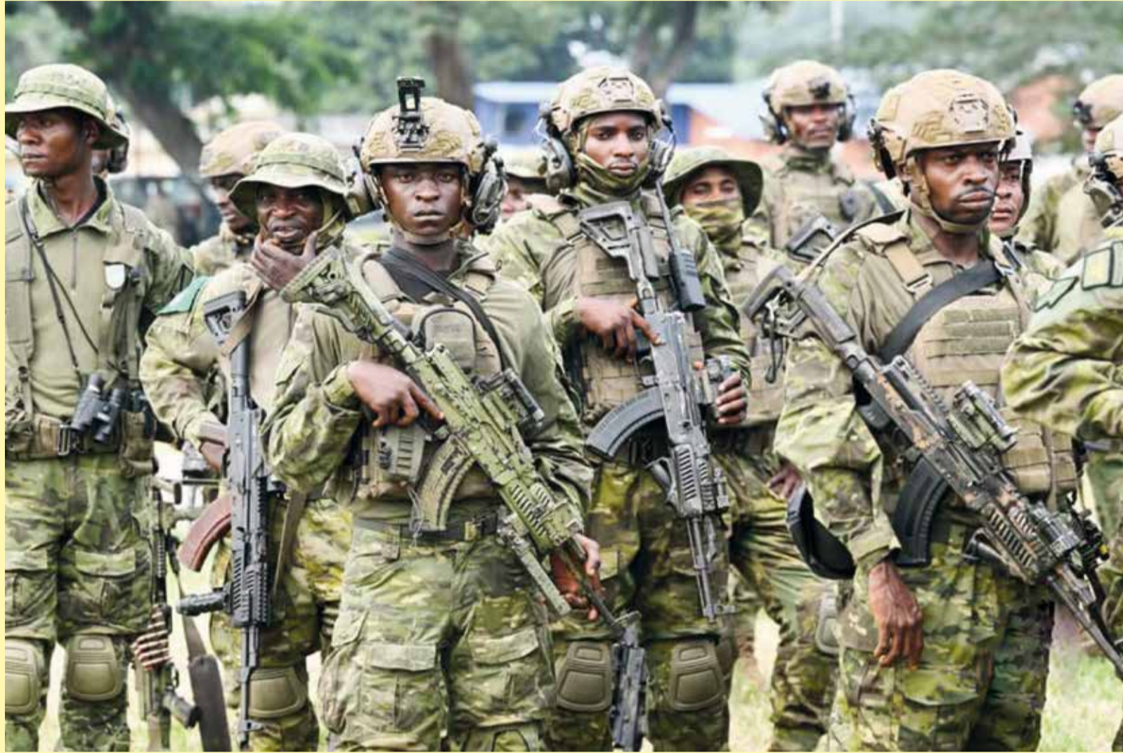
« La Nation reconnaissante dit merci à ceux qui tiennent les lignes, défendent nos frontières ».

Mes très chers compatriotes, L'année dernière, à la même période, je m'adressais à vous au lendemain d'avancées diplomatiques importantes, notamment dans le cadre de l'Accord de Washington et des discussions de Doha. Ces démarches avaient ouvert une espérance et remplacé la tragédie congolaise au cœur des agendas régionaux et internationaux. Elles ont surtout consacré une vérité essentielle : aucune paix durable dans la région des Grands Lacs ne peut se bâtir contre la souveraineté de la République Démocratique du Congo, ni au détriment de la dignité de son peuple. Le choix de la diplomatie n'a jamais été un signe de faiblesse. Il fut le