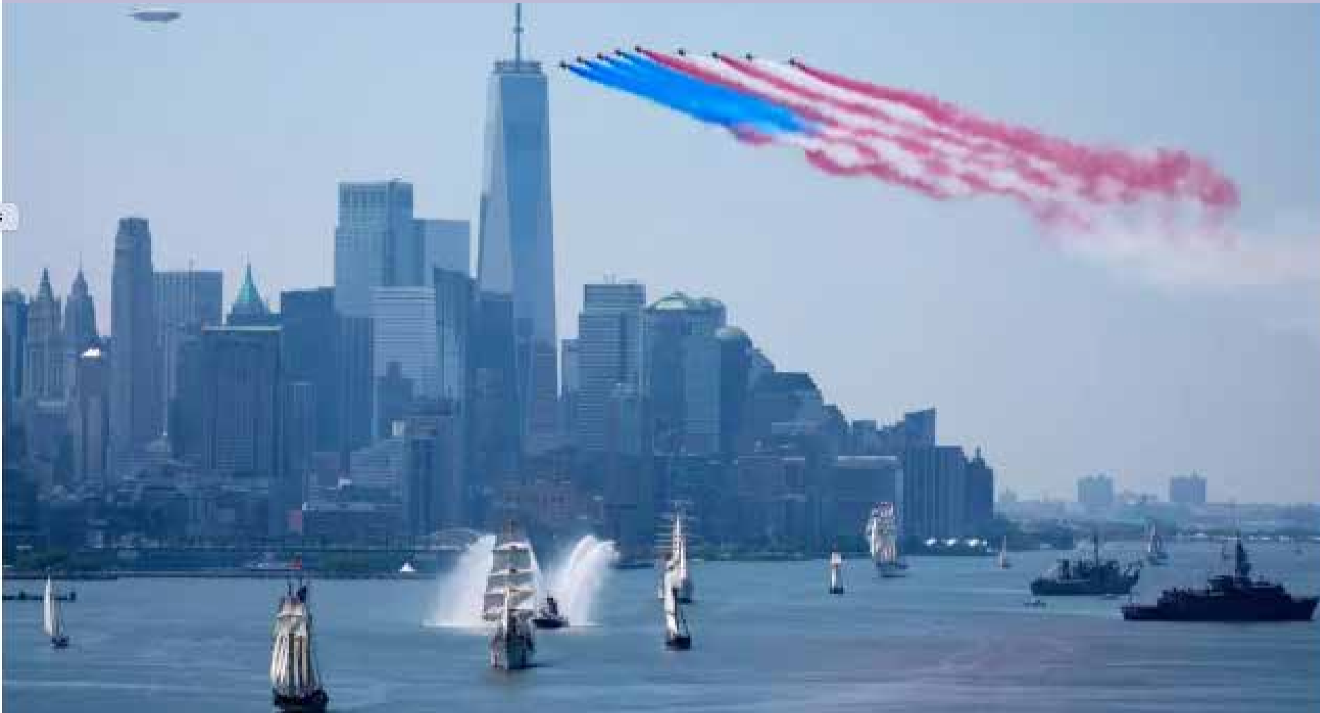
À New York, la grande ville des États-Unis, le ciel couvert des festivités des 250 ans d'indépendance.

L es États-Unis ont célébré samedi 4 juillet leurs 250 ans, un Independence Day particulier, 250 ans après l'adoption de la Déclaration d'indépendance à Philadelphie marquant la rupture de treize colonies avec la Couronne britannique. Un jour qui a coïncidé avec une vague de chaleur suffocante dans l'est des États-Unis.