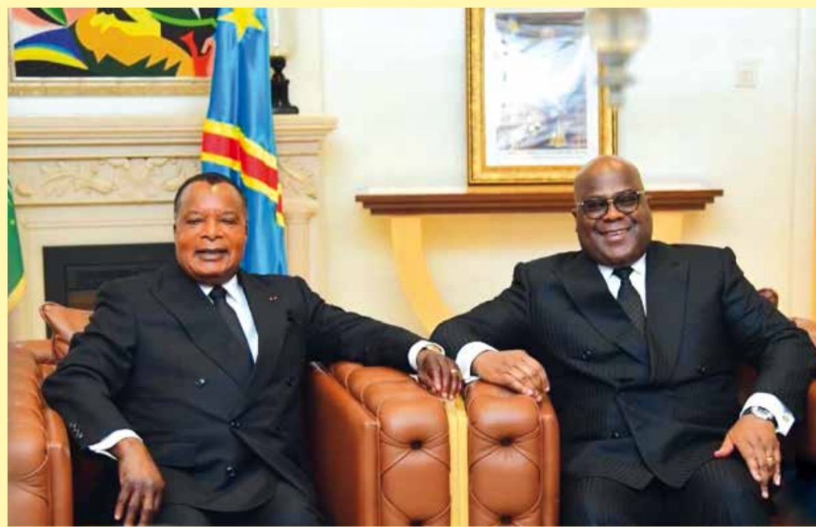
En haut (à g.), le président congolais avec le président Ramaphosa, à dr., avec Denis Sassou Nguesso. En bas avec Évariste Ndayishimiye.

F élix-Antoine Tshisekedi Tshilombo vient d'avoir depuis mi-juin trois rencontres avec ses homologues de la sous-région.