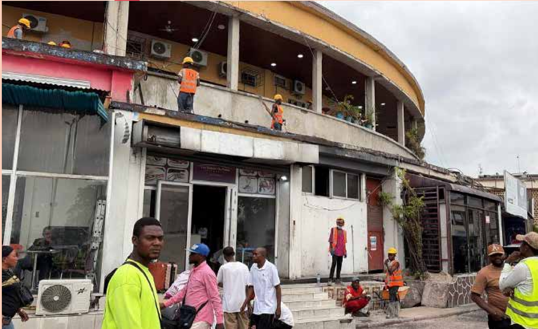
«Tout était entassé, mangé, bu, fumé de manière quelconque, jeté par terre, craché au sol. L'air des tas d'ordures irrespirable».