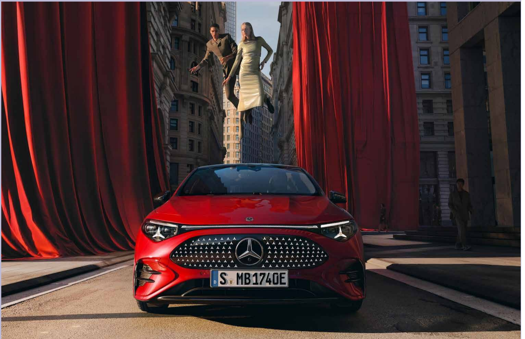
Une berline qui redéfinit les standards du voyage en supprimant l'angoisse de la panne grâce à une recharge express.

La CLA impose sa ligne de berline au design de coupé. Cette silhouette se démarque dans un paysage automobile