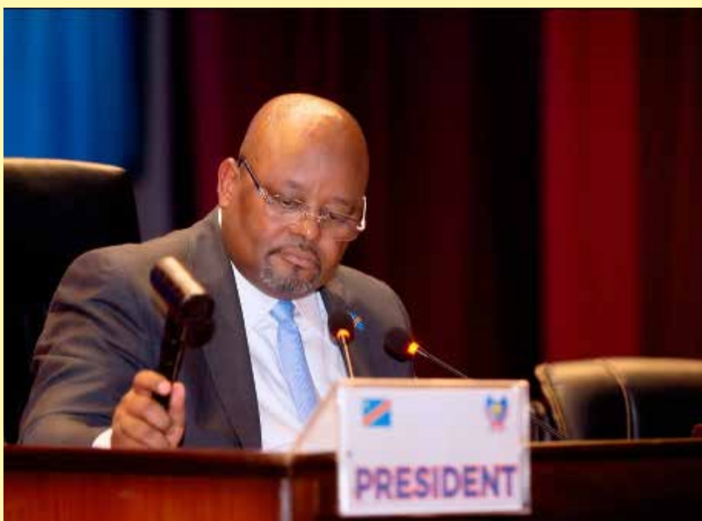
À g. le président Aimé Boji Sangara Bamanyirue. À dr., le ministre des Finances Doudou Roussel Fwamba Likunde Li-Botayi.

«Conformément aux dispositions des articles 18, 26, 27, 35, 77 et 80 de la Loi n°11/011 du 13 juillet 2011 relative aux finances publiques, telle que modifiée et complétée à ce jour, le Gouvernement soumet au Parlement le projet de Loi de finances rectificative de l'exercice 2026, destiné à adapter les prévisions de la Loi de finances initiale à l'évolution de la conjoncture économique et des priorités nationales», lit-on dans l'exposé des motifs de la Loi de Finances rectificative de l'exercice 2026, présenté par le ministre des Finances. «Ce collectif budgétaire est élaboré dans un contexte marqué